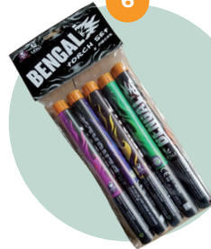
Bengaals vuur/fakkel (F1)