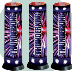
Single shot/ Thunder King