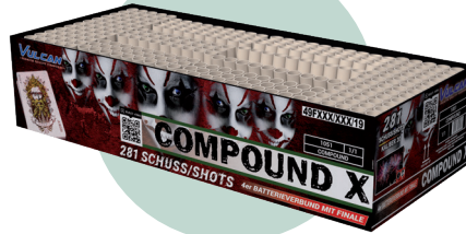
Compound/ samengesteld vuurwerk