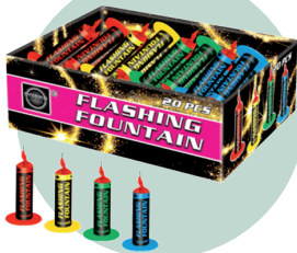
Kleine fontein (F1)