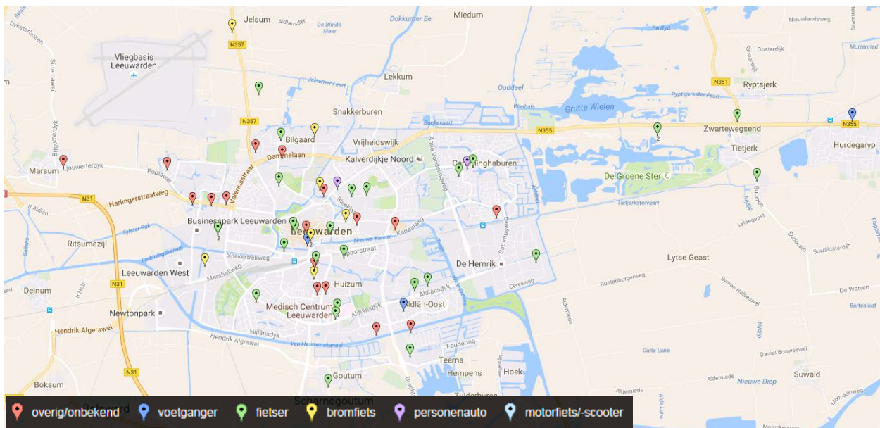
Figuur 4.3 Kaart met exacte verkeersongevalslocaties in Leeuwarden, naar type verkeersdeelnemer