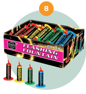
Kleine (F1) fontein