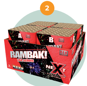
Compound/ samengesteld vuurwerk