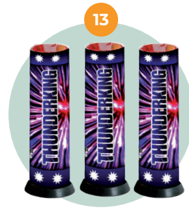
Single shot/ Thunder King