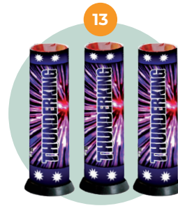
Single shot/ Thunder King