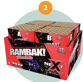
Compound/ samengesteld vuurwerk