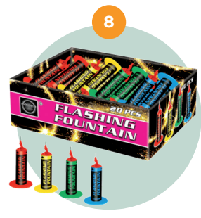
Kleine (F1) fontein