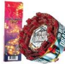
3. Ratelband / Chinese rol