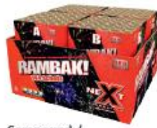
6. Compound / samengesteld vuurwerk